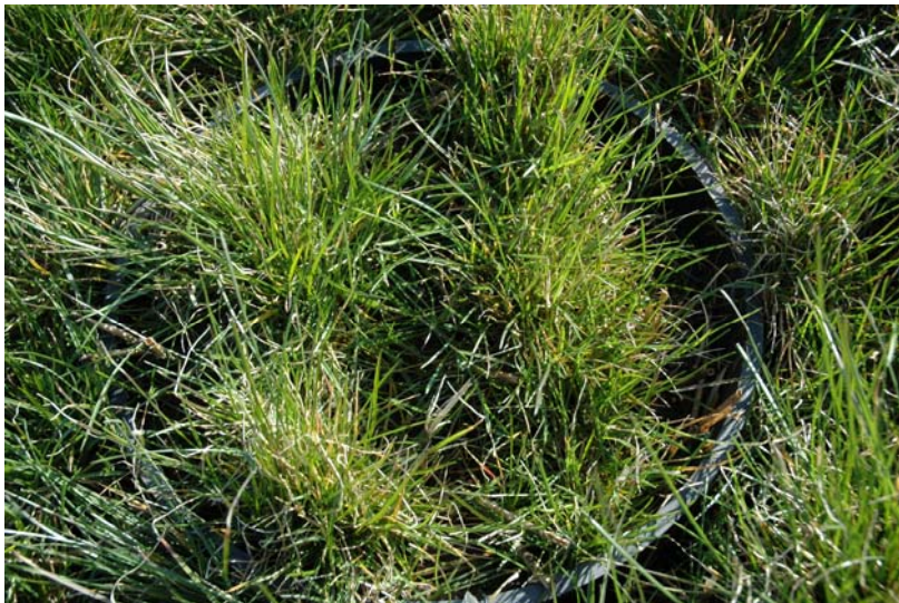
2. års, d. 16-03-07