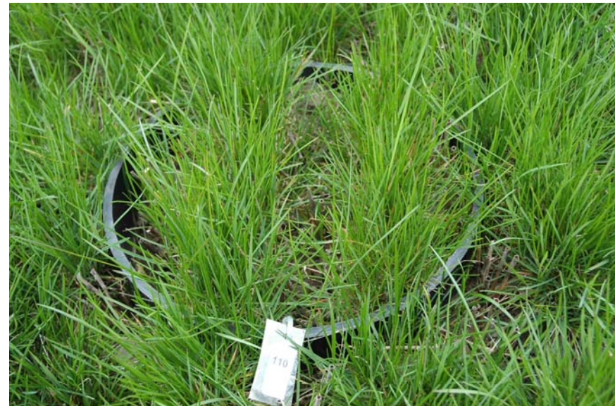
1. års, d. 28-04-06